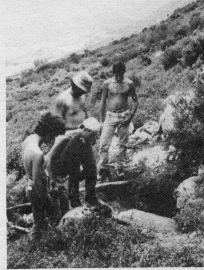
A EQUIPA de desobstrução, momentos antes da primeira incursão à Gruta do Bom Santo