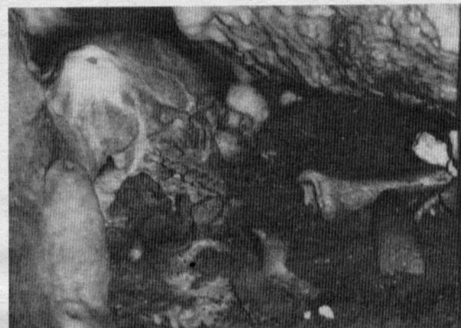
ESTE crânio, dada a sua antiguidade, apresenta já a formação de uma estalagmite