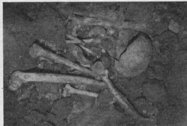
GRANDE parte do espólio encontra-se à superfície, tal como foi deixado originalmente

A atribulada descoberta do Algar do Bom Santo foi sem dúvida inesquecível para todos os que a presenciaram. Assim, publica-se a descrição detalhada dos factos, contada por um dos elementos intervenientes. ■