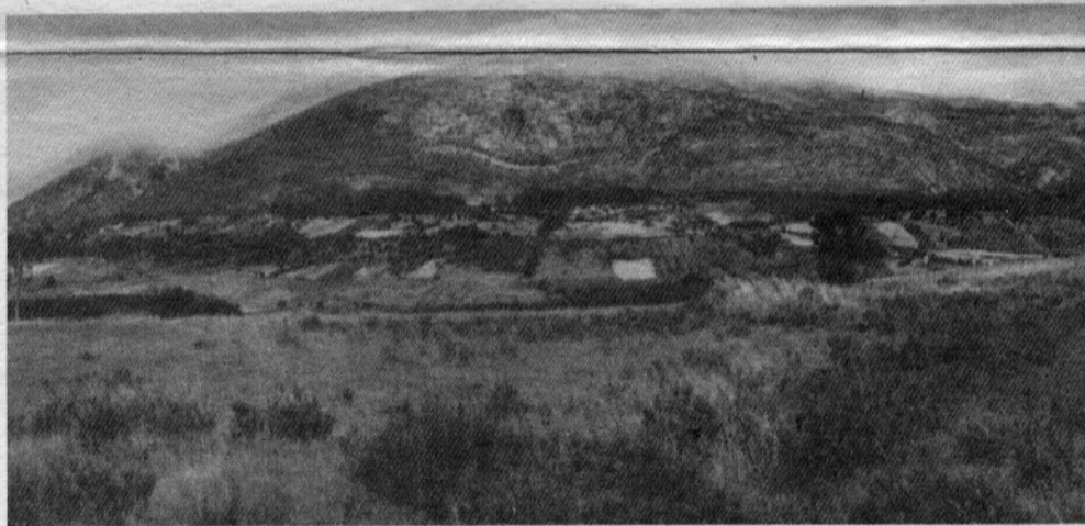
A SERRA de Montejunto revela segredos do passado

ossos estão invulgarmente bem preservados e toda a estação manteve-se intacta ao longo de milhares de anos. O facto que mais terá contribuído para o bom estado da estação, é a existência de um volumoso bloco calcário que bloqueava a entrada, certamente colocado pelos próprios utilizadores, evitando a entrada de outros homens ou grandes animais. Existem inclusive marcas originais de pés nus no solo de uma das salas, facto insólito a singularizar esse túmulo natural. A importância da necrópole eleva-se ao nível mundial, sendo a maior, no género, que se conhece na Europa. Por este motivo, já recebeu a visita de diversas entidades distintas da Arqueologia nacional e internacional e contou com a colaboração voluntária de estudantes estrangeiros vindos propositadamente para o efeito.